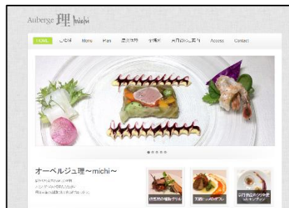
↑オーベルジュ理さんのHPです