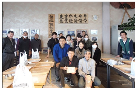
みんなでうどんを作りました！

2日目は、中津万象園という日本庭園の見学した後、お昼に四國館のうどん学校でうどんを作りました。これがなかなか難しく、ちゃんと切れなかったり、切れても細くなったり、太くなったり、とにかく大苦戦・・・。ただ、最後には全員卒業証書を受けました。昼御飯は、お店のうどんを美味しく頂きました。