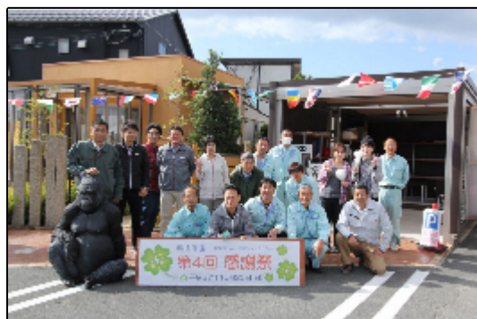
どうもありがとうございました！

今回は秋らしく、『焼き芋』に変更いたしました。寒かった事もあり、焼き芋は大好評 でした。今回は、お子様ともっと楽しんで頂けるように、定番の輪投げはもちろん 射的やストライクナイン、スーパーボーすくい、あとは人気の重機に乗って写真撮影 ができるようにもさせていただき、とても楽しんでいただくことができました。そし て、初めての試みで、弊社のお客様にシフォンケーキを販売していただきました。 せっかくなので、たくさんの方にお集まりいただきますので、何か新しい事ができないかなと 思い、事前にお声がけさせていただき出店していただいたのです。こちらも好評で したので、次回2016年5月の最終日曜日に開催予定の春の感謝祭で趣味の何かを