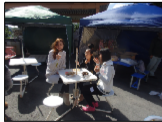
晴れていたのですが風が・・・

今回の感謝祭では、定番の焼きそばや焼き鳥、フランク 綿菓子、好評のピザはもちろんと思っていたのですが