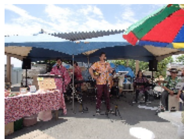
あしびな様のライブ

今回は遠く舞鶴・福知山・日高方面からも参加いただき150名を超える皆さまと楽 しく過ごさせて頂きました。懐かしいお客様のお顔も見ることができお仕事をさせて 頂いた時には、生まれたばかりだったお子様がこんなに大きくなりましたとお顔をみ せて頂き大変嬉しい思いをさせて頂きました。たくさんの方にペットボトルピザの申 し込みをいただきましたが、抽選に外れた皆様にお詫び申し上げます。今回は記念 写真も撮れず少し残念ですがお許し下さい。又、たくさんのお客様にお越しいたさ ながら、お一人お一人お話し出来なかったことが心残りですが、たくさんのお客様の 笑顔を見ることができまして本当に嬉しかったです。