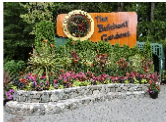
ブッチャートガーデン

9月初旬に、LIXIL様協賛の代理店の研修会がありバンクーバーに行ってきました。自然豊かで「ガーデン」の進んだカナダは一度行って見たかった所でした。もともと飛行機が苦手な私が10時間にも及ぶ飛行に耐えられるか心配でしたが、何とか無事に帰ってきました。バンクーバーは気候も良くて