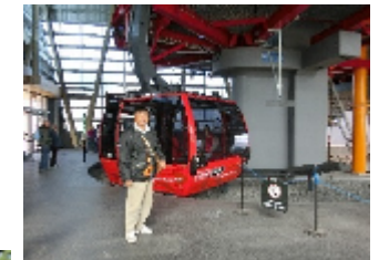
3kmの鉄塔間の大型ゴンドラ