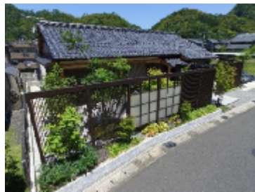
エクステリアコンテスト2016 銀賞 舞鶴市K様邸

昨年の暮れにLIXIL様より嬉しいご報告をいただきました!! 全国最大級のエクステリアコンテストで銀賞(舞鶴市K様邸)。 又、全国の建築関連業者対象で行われますメンバーズ コンテスト2016の外装・エクステリア部門でディティール賞 (京丹後市T様邸)を戴きました。