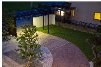
翌年(2013年)のメンバーズコンテスト