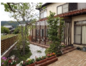
2012年エクステリアコンテスト

後日営業さんから”関西地区入選しました!!特別賞受賞です!!”との嬉しい 連絡を受けました。すぐにお客様にご 連絡させて頂き、お客様の笑顔を見て 毎年応募するようになりました。今後 もデザインや技術の向上をめざし頑張 っていきますので応援の程、宜しくお 願い致します。