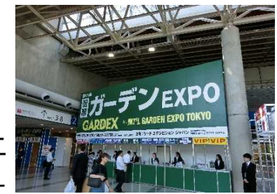
↑ 数年前のガーデンEXPO

■やまちゃん通信ご不要の方は、お手数ですがお名前を書いてそのままFAXして頂くか、お電話にてお申し付けください。