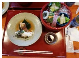
↑ こんにやく懐石一部

又山形は「こんにやく」が有名なので「こんにやく番所」さんで「こんにやく懐石」を頂き美味しさを堪能致しました。