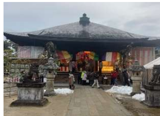
↑天橋立知恩寺文殊堂

今年も「文殊堂十日えびす」に・「おみくじ」と「福棒」を引きました。すると『 大吉 』と『 2等 』が当たりました。いつも5等だったのですごく嬉しい気分になりました。今年は業界的には不況と言われていますので、数年前より参拝している「伏見稲荷大社」にも参拝。ただ腰が痛いので「お山」には登らずに参拝・御祈禱をお願いして帰ってきました。腰痛の為初詣にも行けてなかったので(1月末に控えている手術前の「神頼み」も兼ねて)、恒例の「伊勢神宮」にも友人と参拝してきました。 大安 にこだわり今年も16日の朝の参拝。ここ数年大手企業さんと一緒にならず一番下の「御神楽」を舞ってもらってましたが、今年は大手トラックメーカーと一緒に久しぶりに上から2番目の「 別大々神楽 」舞って頂きました。今年は今までになく寒くてちらほら小雪が舞い始めるなど寒い参拝になりました。