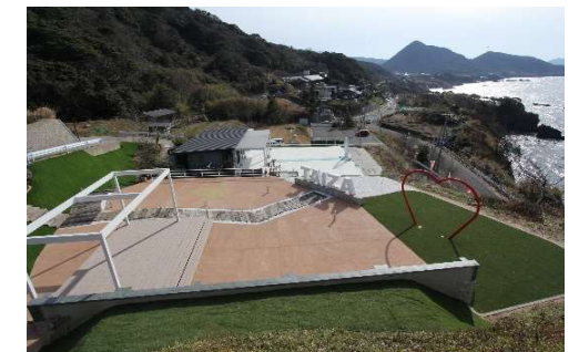
↑寿海亭 間人テラス「My Sunshine」様全景