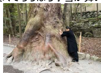
↑御神木からパワー頂きました

「内宮」・「下宮」・「猿田彦神社」と毎年参拝するコースを回りました。赤福の由来となった『 赤福慶福 』のいわれを教えて頂き赤福本店でぜんざいを頂き温まりました。