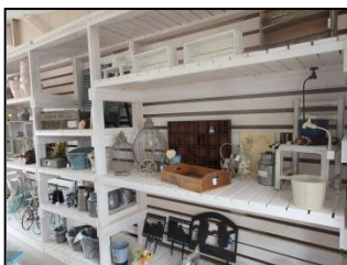
↑ピースフルガーデン店内