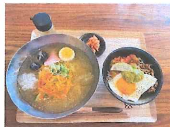
↑美味しかった冷麺と日替わりご飯