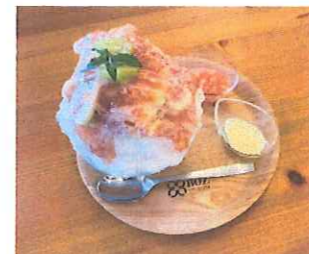
↑フルーツがいっぱいのかき氷