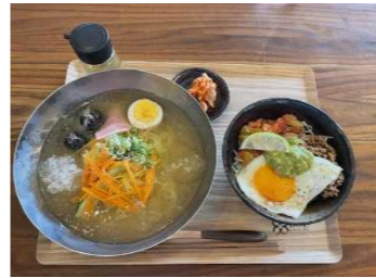
↑美味しかった冷麺と日替わりご飯