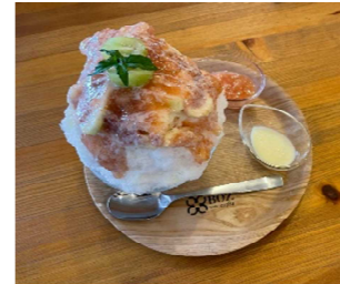
↑フルーツがいっぱいのかき氷