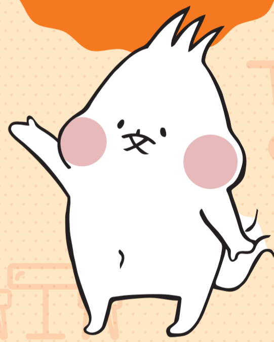
文化庁広報誌「ぶんかる」キャラクター ぶんちゃん