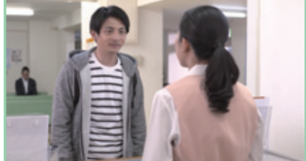
8-1.かぜをひいたみたいです。