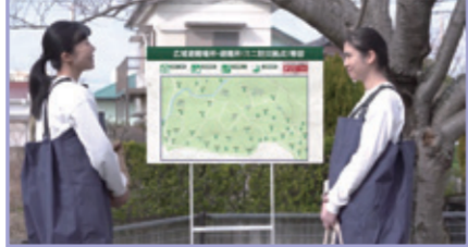
2-1.これがひなんばしよのマークです。