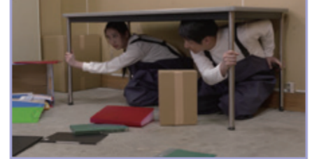
2-3.またおおいじしんがきたらたいへんです。