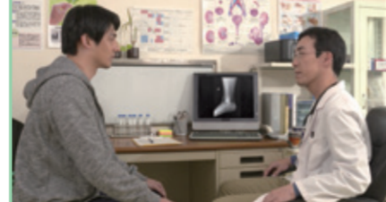
8-2.おふるにはいってもいいですか。