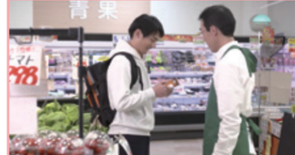
2-2.これ、おさげがはいていますか。