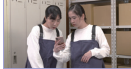
2-2.さっきてんきよほうで