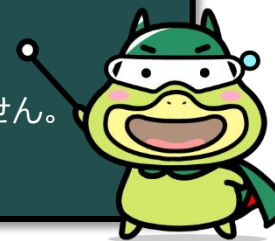
労働基準局広報キャラクター「たしかめたん」